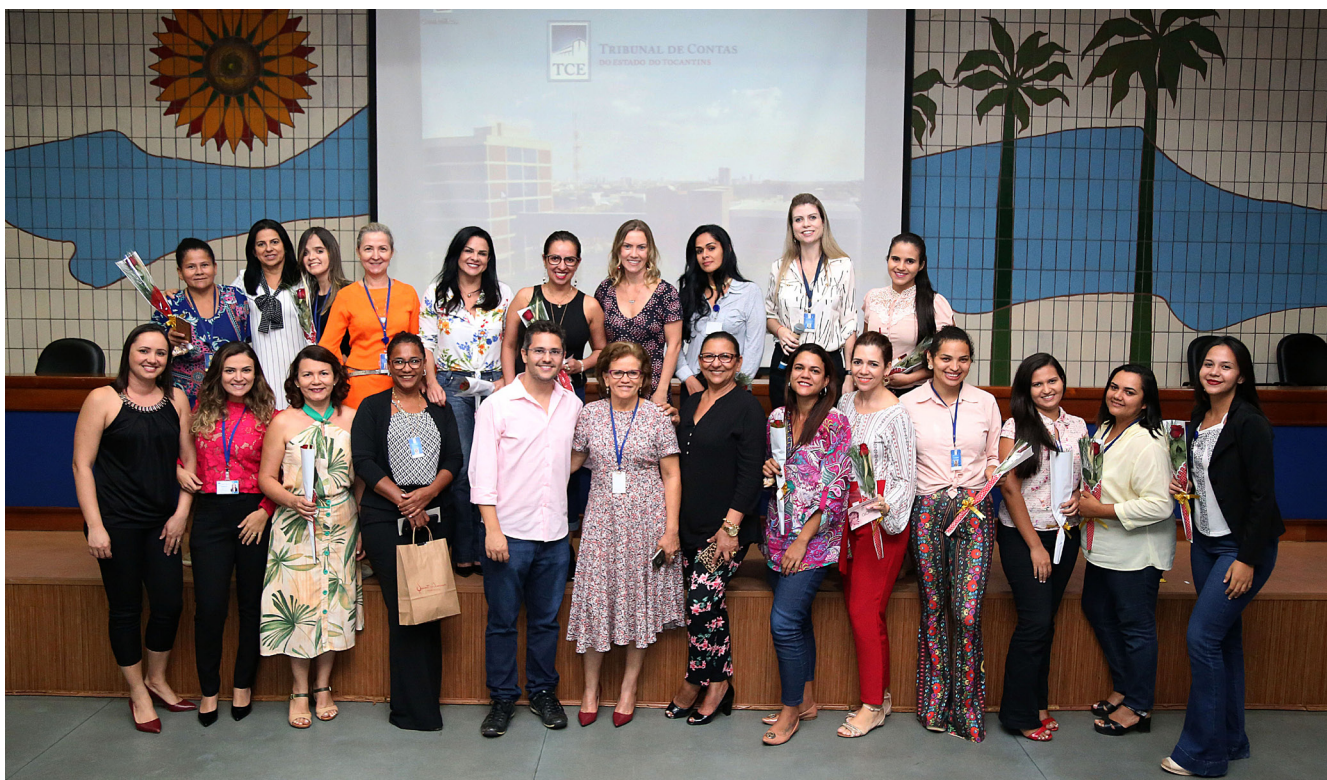
Servidoras do Tribunal participaram de palestra com psicólogo e receberam vários brindes