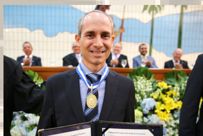
Procurador-geral do Estado do Tocantins - Nivair Vieira Borges