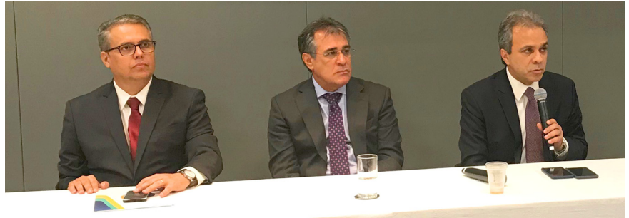
Conselheiro Severiano faz parte da nova diretoria para o biênio 2019 – 2020

Severiano Costandrade destaca a importância do Tocantins em compor a mesa diretora. “Fazer parte do Colégio de Presidentes dos Tribunais de Contas do Brasil é de extrema importância, pois, assim, podemos integrar as Cortes de Contas e uniformizar ações, com vistas ao fortalecimento do Controle Externo e incentivo às políticas públicas em benefício da sociedade”, ressalta Costandrade.