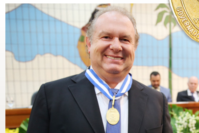
Governador do Tocantins - Mauro Carlesse