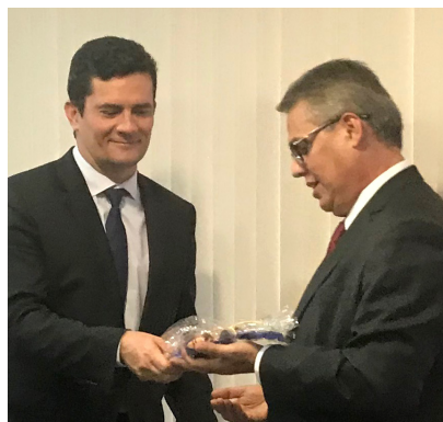
Reunião ocorreu no Ministério da Justiça