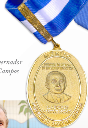
Colar do Mérito Governador Siqueira Campos

O Colar do Mérito é a maior honraria concedida pela Corte destinada a reconhecer pessoas ou instituições que tenham prestado relevantes serviços em prol da administração pública, do sistema de Controle Externo ou do Estado do Tocantins. Já a Medalha do Mérito Funcional é uma forma de reconhecimento aos servidores pelo empenho e anos de serviços prestados ao TCE Tocantins e à comunidade.