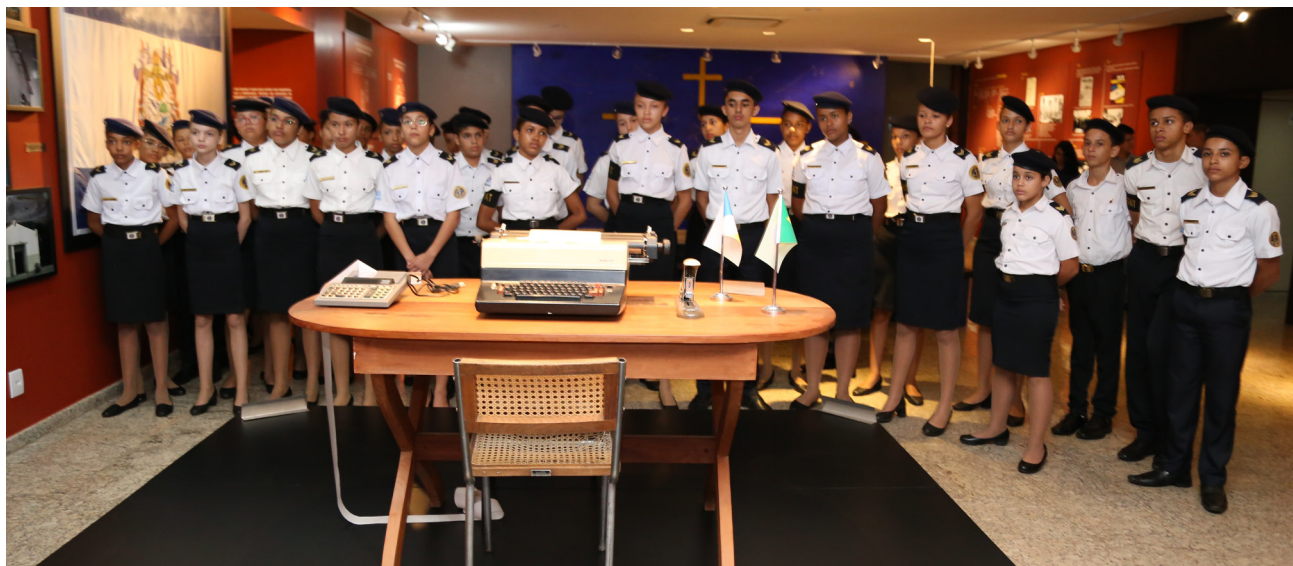
Alunos da Escola de Tempo Integral Almirante Tamandaré visitaram o memorial do TCE/TO

Projeto continua dando espaço a jovens estudantes para conhecerem a Corte