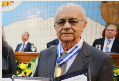
Atual prefeito de Paraíso do Tocantins e ex-governador - Moisés Avelino